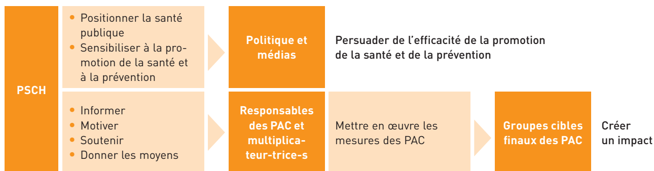
FIGURE 2: COMMUNICATION DE PROMOTION SANTÉ SUISSE