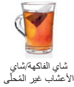
شاي الفاكهة/شاي الأعشاب غير المُحلّى