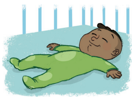
... ከዕርፍ ብድሕሪኡ

ወለደይ ኣዚ ዝስዕብ ብምግባር ክኸግዘኒ ይኸክሉ። » ምሳይ ናይ ዓይኒ ንዓይኒ ምጥምማት ንምግባር ግዜ ብምውሳድ። » ኣነ ናጻ ኮይነን ብውሕስነትን ዝንቀሳቐሰሉ ኩርናዕ ብምፍጣር » ንካይ ንምሕቓፍ ግዜ ብምውሳድ » ናተይ ምትንባሃትን ድሌታትን ንምምላስ ክምሃሩ