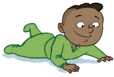
... ምምሃር ምቅደጻር ኣቃውማይን ምንቅስቃሳተይን