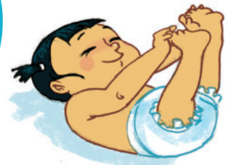
... ምድህሳስ ሰብነተይ

ወለደይ ኣዚ ዝስዕብ ብምግባር ክኸግዘኒ ይኸክሉ። » ምሳይ ናይ ዓይኒ ንዓይኒ ምጥምማት ንምግባር ግዜ ብምውሳድ። » ኣነ ናጻ ኮይነን ብውሕስነትን ዝንቀሳቐሰሉ ኩርናዕ ብምፍጣር » ንካይ ንምሕቓፍ ግዜ ብምውሳድ » ናተይ ምትንባሃትን ድሌታትን ንምምላስ ክምሃሩ