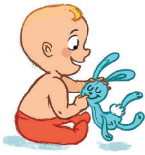
... ንምዕትዓት ነገራትን ብክኩም ምጽዋትን